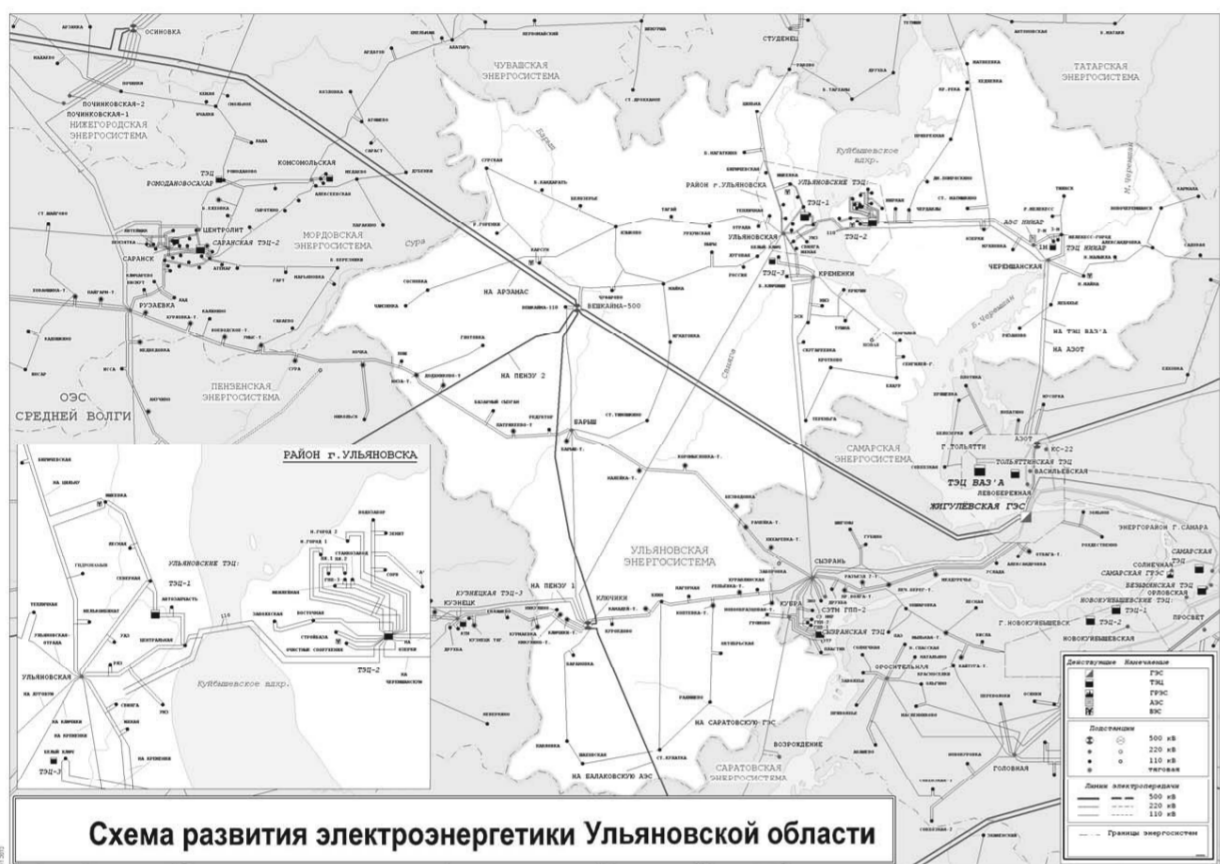
Рис. 2. Карта-схема электрических сетей 110 кВ и выше энергосистемы Ульяновской области на период 2017-2021 годов